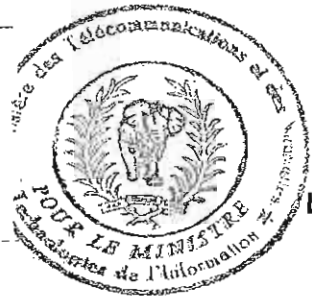
LIA BI DOUAYOUA

Le Ministre des Télécommunications et des Nouvelles Technologies de l'Information